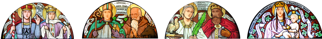
vitráž kapličky sv. Antonína Paduánského

Při práci na rekonstrukci rotundy svatého Antonína a obnově vitráže s vyobrazením Panny Marie se podařilo zjistit, kdo byl dárcem a proč pro vitráž zvolil právě tento motiv. I na dalších vitrážích jsou uvedena jména dárců, ale bylo by dobré zjistit jejich pohnutky a další podrobnosti, které v průběhu času, který od jejich vzniku uplynul, upadly v zapomnění. Nebyly zaznamenány ani v kronice či jiných známých záznamech, ze kterého by se daly zjistit. Uvítali bychom, kdyby se nám přihlásil každý, kdo o tom něco ví.