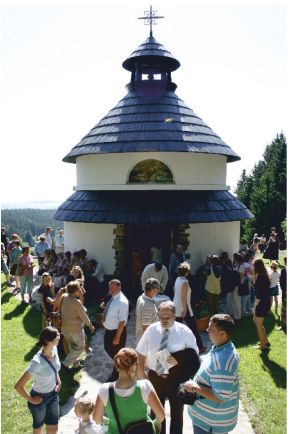
Poutí 16. červen 2012

Při pouti, která se na Javorníku koná vždy do víkendu po svátku svatého Antonína, se v sobotu před polednem shromáždil početný dav místních i návštěvníků Javorníku, mezi kterými byla řada zdejších rodáků. Společně se vydali k opravené kapli – rotundě svatého Antonína. Ve slunečném dnu zářila obnovenou fasádou. Před kaplí se konala slavnostní bohoslužba a svěcena byla i rekonstruovaná studánka. Veselí pokračovalo s přispěním sponzora Plzeňského pivovaru a za krásného počasí, ve vsi kulturním programem s večerní tancovačkou. Za rok opět zde v sobotu 15. června 2013.